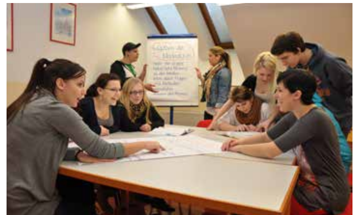
Caritas Schulzentrum Josee, Ebensee