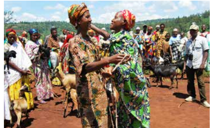
Caritas Auslandshilfe, Burundi (Versöhnungsprojekt)