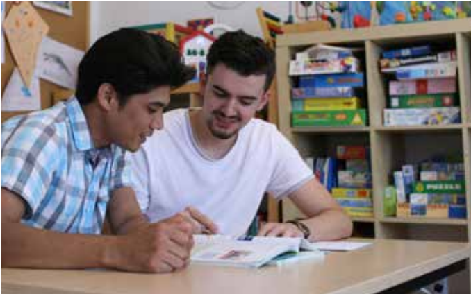
Caritas Flüchtlingshaus Waldeggstraße, Linz