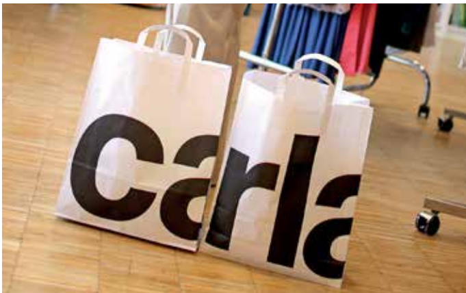
Caritas Second-Hand-Shop CARLA, Linz