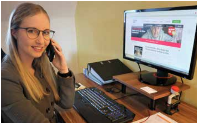
Caritas Sozialberatung, Wels

Wer: 8 - 19 Jahre; Spiel: max. 20 Personen