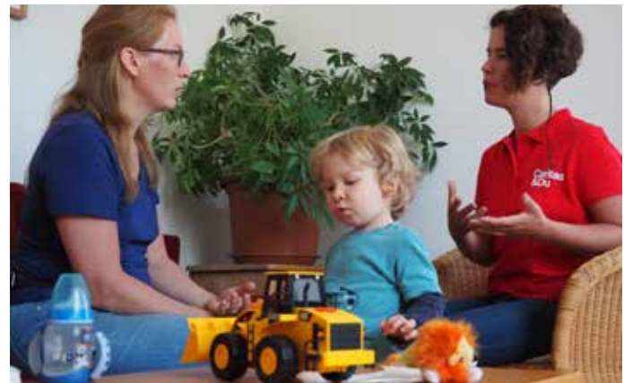
Caritas Haus für Mutter und Kind, Linz