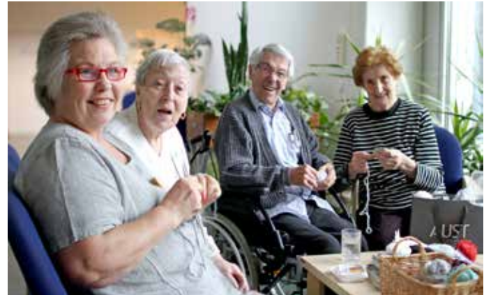
Caritas Seniorenwohnhaus St.Anna, Linz (Strickrunde)