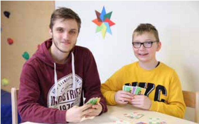
Caritas St.Isidor, Leonding