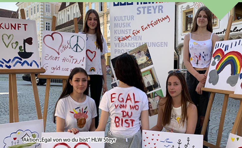
Aktion „Egal von wo du bist“ HLW Steyr

In diesem Workshop setzen sich die Teilnehmer*innen aktiv mit den Themen Mitgefühl, Zuhören und (gewaltfreie) Kommunikation auseinander. Durch praktische Übungen, Rollenspiele und gemeinsame Reflexion wird das Bewusstsein für Gefühle und Bedürfnisse gestärkt. Dabei wird ein bewusster Umgang mit Sprache gefördert – hin zu einer Kommunikation, die verbindet statt trennt. Der Workshop stärkt die sozialen Kompetenzen der Teilnehmenden, fördert ein respektvolles Miteinander und bietet Werkzeuge zur konstruktiven Konfliktlösung.