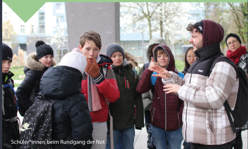
Schüler*innen beim Rundgang der Not

Hinweis: Vor dem digital unterstützten „Rundgang der Not“ bitte die App „Espoto“ herunterladen.