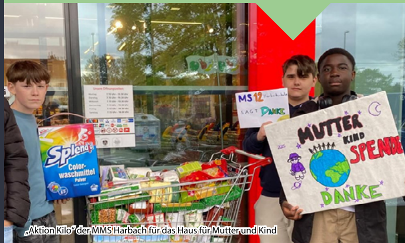
„Aktion Kilo“ der MMS Harbach für das Haus für Mutter und Kind

Die Teilnehmer*innen dürfen für verschiedene Personen in unserer Gesellschaft ein Budget erstellen. Dieses gibt zum Beispiel Einblick in die Lebenssituation von Mindestpensionist*in und Topmanager*in. Es ist vorprogrammiert, dass es bei vielen knapp wird. Doch wenn sich erst das Schicksalsrad dreht und Unvorhergesehenes passiert, wird es so richtig spannend.