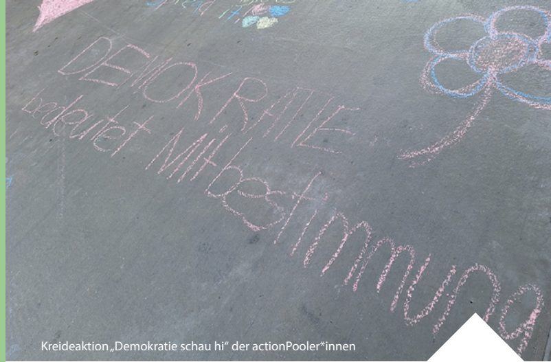
Kreideaktion „Demokratie schau hi“ der actionPooler*innen