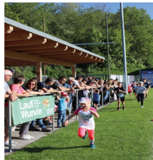
LaufWunder VS Tragwein