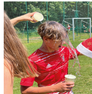
LaufWunder MS Altenberg