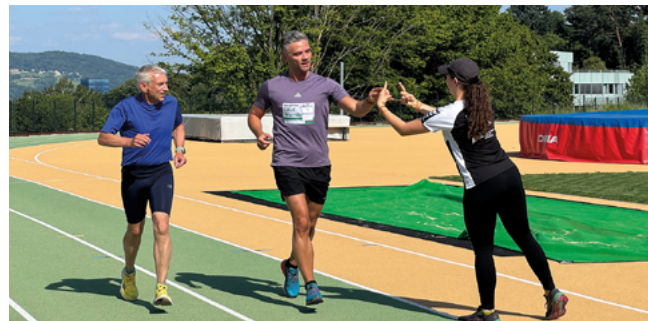
LaufWunder PHDL Linz