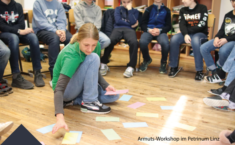
Armuts-Workshop im Petrinum Linz