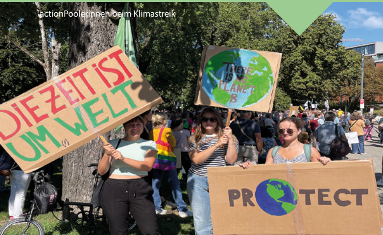
actionPoolerinnen beim Klimastreik