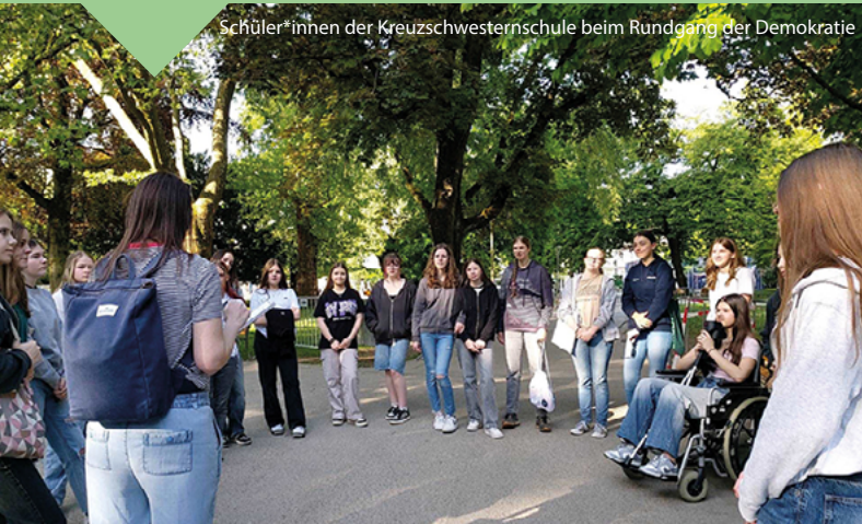
Schüler*innen der Kreuzschwesternschule beim Rundgang der Demokratie

Hinweis: Bitte vorab die App „Espoto“ runterladen.