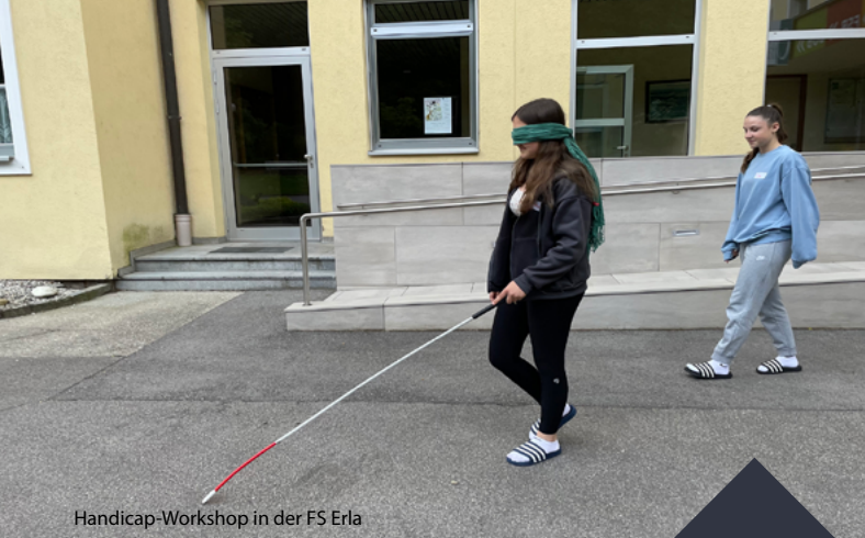
Handicap-Workshop in der FS Erla