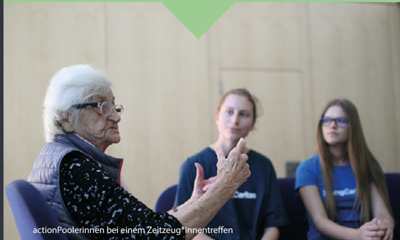
actionPoolerinnen bei einem Zeitzeug*innentreffen

Ab der Oberstufe bieten wir diesen Workshop mit dem Schwerpunkt Demenz an.